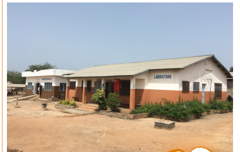
Programme de santé