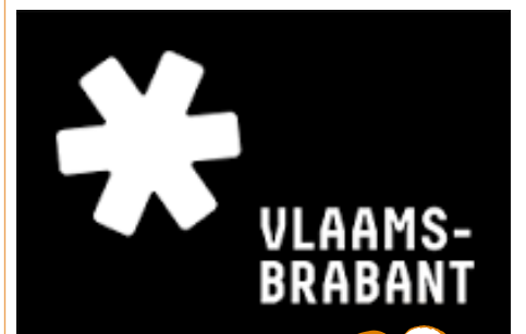
Fondation sous la loupe