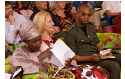
La cérémonie d'inauguration du CIAP 2

L'équipe béninoise de la Fondation Hubi & Vinciane compte à présent neuf personnes. Tous sont des professionnels engagés qui assurent l'exécution, la coordination et la gestion du programme de "Lutte contre la Malnutrition".