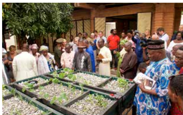
La première formation qui s'est donnée au CIAP était la technique des Aquaponics qui combine l'élevage des poissons et la culture des légumes. Huit diplômés ont été remis.