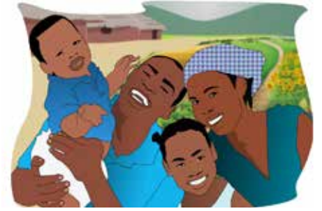
Un 'rêve avec le Bénin' vers une 'action au Bénin' 1