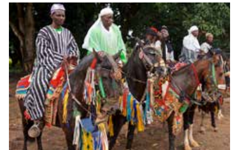
Intensément émouvant et impressionnant 3

Le nouveau bâtiment CIAP, "Centre d'Innov'Action de Parakou" est enfin terminé. Il est en même temps écologique de par l'utilisation des matériaux locaux et novateur par l'application de nouvelles techniques de construction.